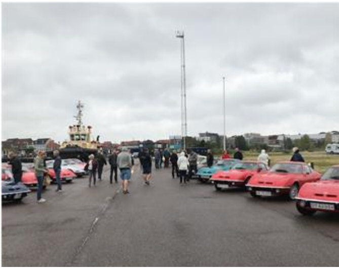
Det var bidende koldt og klamt på havnen i Fredericia.