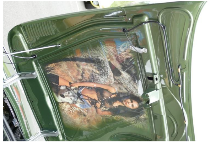
Der er nogle der udsmykker deres fronthjælm – på den indvendige side!! Bilen var med med samme udsmykning til det danske Europatræf i 2003 i Sæby – så hun holder sig godt!

Klubben havde arrangeret en rigtig fin køretur i adstadigt tempo rundt omkring i det flade men også meget smukke landskab og små byer.