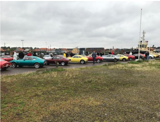
Så desværre var der ikke mange nysgerrige og kigge på vores flotte biler, som sidste gang vi var der.