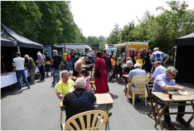
Og boder med diverse forfriskninger