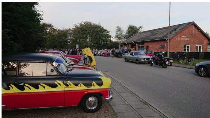
Hjordkær gl. brandstation

Efter en lille times kørsel ankom vi til en gammel brandstation nær Rødekre.