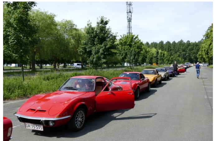
Så er en del af deltagerne klar til den fine fællestur i det smukke belgiske landskab

Klubben havde arrangeret en rigtig fin køretur i adstadigt tempo rundt omkring i det flade men også meget smukke landskab og små byer.