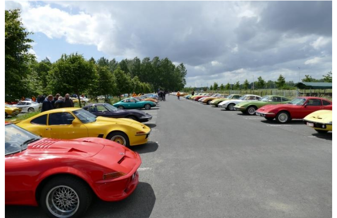
En lille del af GT'erne fra den store GT parkering

På selve træfpladsen i Puyenbroeck var der ikke mulighed for overnatning, så alle skulle ud at køre hver dag for at komme til træfpladsen – hvilket i øvrigt er den eneste anke jeg har omkring et veltilrettelagt arrangement. Jeg tænker her hvor er det godt at vores Europatræf næste år – der ligger ALT inden for nærmest kravle afstand!