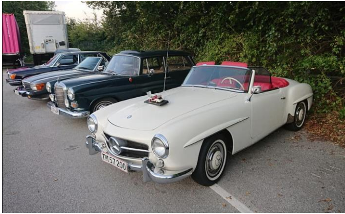
Mercedes Benz 190SL Cabriolet

Vi var samlet lidt over 150 veteran køretøjer denne aften.