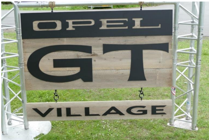
Bilerne, salgsboder og bespisningen foregik i GT Village.

Blev i år afviklet i Belgien ved Wachtebeke i Belgien – som sædvanligt i pinsen. Det var den belgiske Opel GT Klub der stod for arrangementet og de kunne dermed også fejre deres 30-års jubilæum som klub.