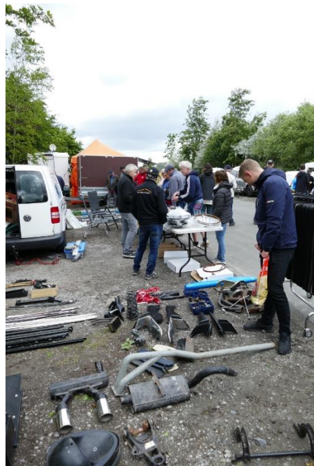
Der var som sædvanligt flere salgsboder med nye og brugte reservedele og andet merchandise

Ellers gik tiden md det sædvanlige – sparke dæk, fortælle løgnehistorier, snakke med andre kendte som nye træfdeltagere, spise et par pølser og drikke en fadbamse i ny og næ. Og der var rigtig meget at kigge på af de forskellige modeller, ombygninger og modificeringer, så snakken gik lystigt. Det er et hyggeligt folkefærd de GT ejere og co - drivere!!