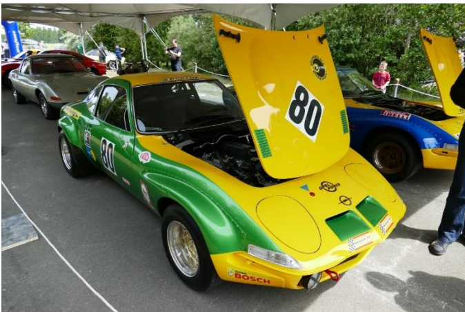
Der var også udstillet flere specialmodeller af GTèn – her en Conrero