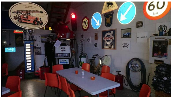
Et kig ind i museet

Den gamle brandstation var indrettet med en del gamle skilte og veteran effekter.