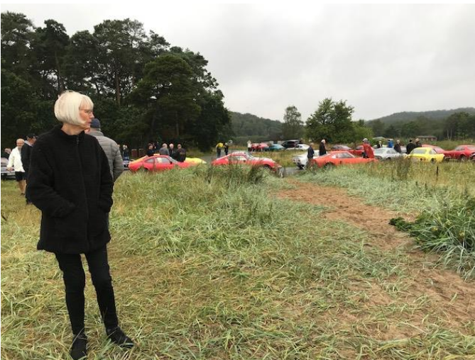
Vejret blev gradvist bedre under køreturen og vi kom i læ ved skov nær strand hvor der var mulighed for at strække benene

Fra havnen kørte vi en tur rundt i området og vejret blev langsomt mildere stemt.