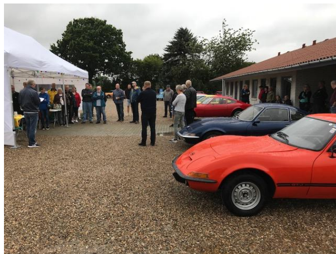
Et lille udsnit af de 40 GT'ere

I alt var der samlet 40 GT'ere og 65 personer, så det må siges at være flot.